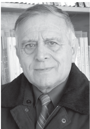
32. „Nu ucide țânțari cu tunul!“ (Confucius)

Din amintirile despre școala băileșteană de odinioară, nu puteau lipsi referirile la... bătaie! Nu – Doamne ferește –, nu vom scrie despre încăierări, scandaluri sau alte asemenea violențe extreme, ci despre micile corecții fizice aplicate unor elevi îndărătnici, obraznici sau recalcitranți.