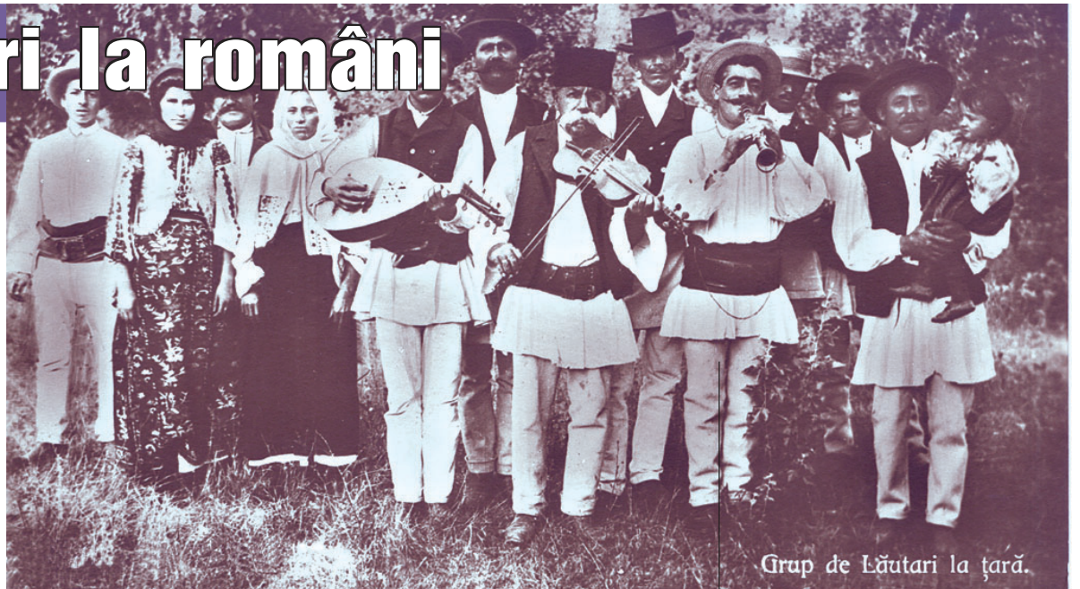
Grup de Lăutari la țară.

16 Mai – în această zi cad Todorușele – în această zi femeile nu lucrează – se pune peste tot pelin,