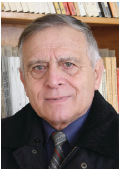
36. „O, ce frumoase lumi s-au ivit și au dispărut în sufletul meu“