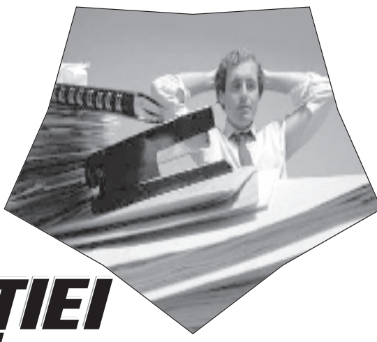
Funcționarilor Primăriei Băilești