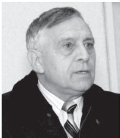
47. "Recunosc că literatura este o mare pierdere de timp. Dar e dintre marile pierderi de timp care pot fi un câștig. Pe când celelalte..."