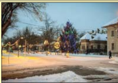
Tremurăm la propriu