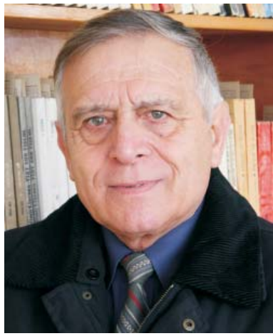
22. „Edite et bibite, post mortem nulla voluptas” 1 Epicur