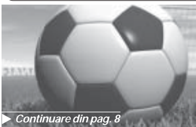
Continuare din pag. 8

Paralizant pentru noi, \n min. 9 "copiii" de la Gic# Popescu (unul n#scut \n 1992, nou# 1993 [i cinci \n 1994) au deschis scorul prin Bu]ic#, la o grav# gre[teal# a por- tarului Tudoric#, acesta box@nd \n plas# o minge foarte u[oar#.